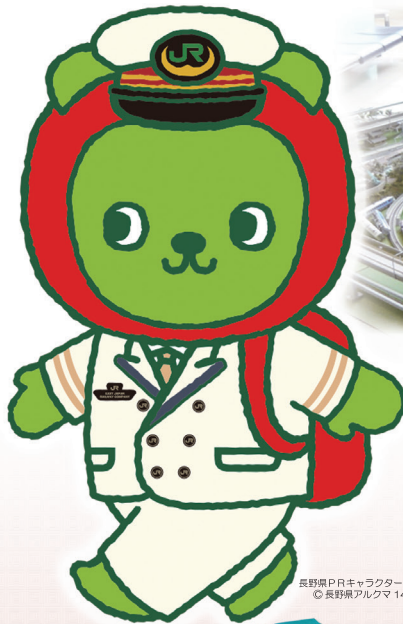
長野県PRキャラクター「アルクマ」 ©長野県アルクマ 14-0020