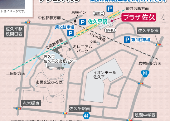
※掲載の内容は2021年11月現在の情報です。